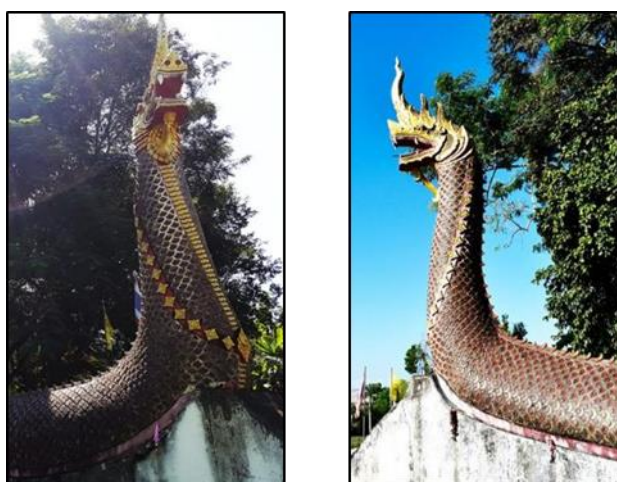
ภาพที่ ๗ : บันไดนาค

บันไดนาค ๒ ตัว คู่กัน คือ พญาศรีสุทโธนาคราช และนางพญานาคิณีศรีปทุมมาซึ่งตั้งอยู่ด้านหน้าทางเข้าพระบรมธาตุซึ่งสามารถเห็นวิวทิวทัศน์ของเมืองน่านได้ในบริเวณกว้าง