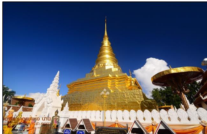
ภาพที่ ๕ : เจดีย์วัดพระธาตุแช่แห้ง ๙๑

องค์พระธาตุแช่แห้งเป็นพระธาตุที่มีขนาดสูงถึง ๕๕.๕ เมตร ตั้งอยู่บนฐานสี่เหลี่ยมจัตุรัส กว้างด้านละ ๒๒.๕ เมตร มีสี่เหลี่ยมอร่าม เนื่องจากบุด้วยแผ่นทองเหลือง ลักษณะของเจดีย์ทรง ระฆัง ส่วนฐานทำเป็นฐานหน้ากระดานสี่เหลี่ยมขนาดใหญ่ รองรับฐานบัวลูกแก้ว ย่อเก็จ ถัดขึ้นไปเป็นฐานหน้ากระดานสี่เหลี่ยมและแปดเหลี่ยมซ้อนลดหลั่นกัน ๓ ชั้นองค์ระฆังมีขนาดเล็กบัลลังก์ทำเป็นแท่นสี่เหลี่ยม ย่อเก็จ ฐานหน้ากระดานกลมเป็นกระดานสี่เหลี่ยมและแปดเหลี่ยม และชั้นบัวคว่ำเหนือฐานแปดเหลี่ยม ตกแต่งคล้ายกลีบบัว หรือลายใบไม้แทนลายดังกล่าวนี้คงได้รับอิทธิพลจากศิลปะพม่า ซึ่งนำมาต่อเติมขึ้นภายหลังเมื่อล่วงเข้า พุทธศตวรรษที่ ๒๔ แล้ว