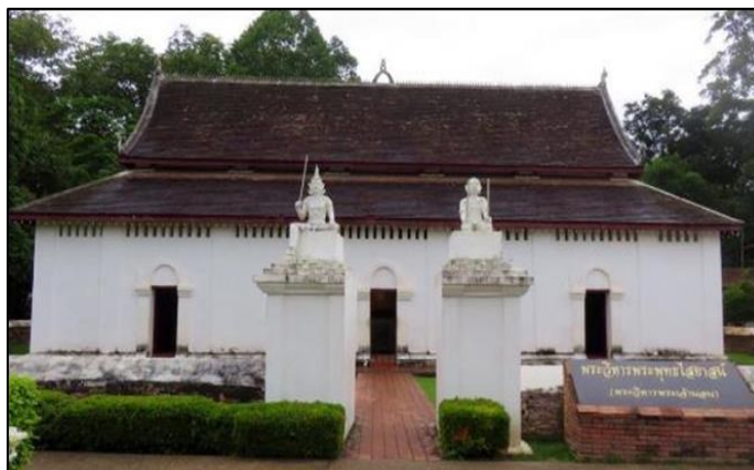
ภาพที่ ๖ : วิหารพุทธไสยาสน์ ๒

วิหารพุทธไสยาสน์ อยู่ทางด้านหน้านอกกำแพงแก้วขององค์พระธาตุแช่แห้ง มีเจดีย์สี่ขา ศิลปะพม่าเป็นเจดีย์ที่จำลองมาให้ชาวพุทธได้บูชา ชาวบ้าน เรียกว่า พระธาตุเซวาดากองตั้งอยู่ทางซ้ายมือเมื่อเดินขึ้นมาถึงบริเวณลานด้านหน้าวัดพระธาตุวิหาร ก่อสร้างตามแนวยางขององค์พระ มีประตูทางเข้าด้านหลังคือ ทิศใต้