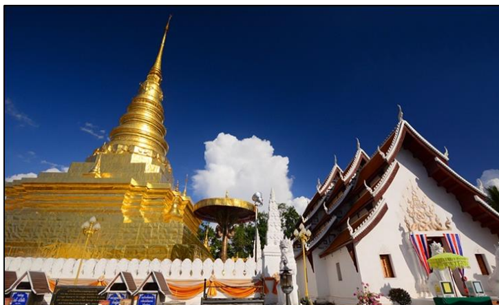
ภาพที่ ๒ : วัดพระธาตุแช่แห้ง จังหวัดน่าน ๕๓