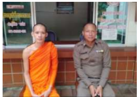
สะอาด เรือนสอน