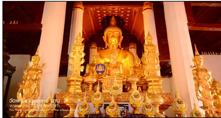
ภาพที่ ๔ : วิหารพระเจ้าทันใจ ๙๐