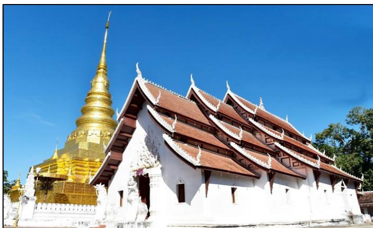
ภาพที่ ๓ : วิหารหลวงวัดพระธาตุแช่แห้ง ๘๙

วิหารหลวงอยู่ทางด้านทิศใต้ขององค์พระธาตุเป็นวิหารขนาดใหญ่ ๖ ห้อง ห้องกลางมีขนาด ๓ ห้อง และต่อชั้นลาดออกไปทางด้านหน้า ๒ ห้องและ ด้านหลัง ๑ ห้อง ภายในวิหารหลวงมีพระเจ้าล้านทองเป็นพระประธาน พุทธลักษณะปาง มารศรีวิชัยศิลปะล้านนา ประทับนั่งบนฐาน เป็นพระพุทธรูปองค์ที่สวยงามในจังหวัดน่านองค์หนึ่งและ เป็นพระพุทธรูป คู่บ้านคู่เมืองมาช้านาน พระพุทธรูปประทับยืน ประดิษฐานใน วิหารหลวงจำนวน ๒ องค์ปัจจุบัน องค์จริงมอบให้พิพิธภัณฑ์ จ.น่านอีกองค์ ถูกโจรกรรมและยังไม่ได้กลับคืน องค์ที่เห็นจำลองจาก องค์จริงทำพิธีหล่อเททองเมื่อปี พ.ศ. ๒๕๕๐ หน้าบันประตูของวิหารหลวงเป็นปูนปั้นลายนาคเกี่ยวระหวัดกัน ๘ หัว เอกลักษณ์ของศิลปะ เมืองน่าน