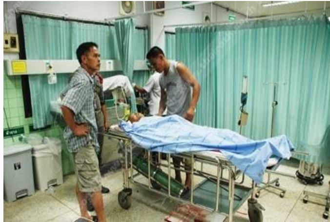
ภาพ วัยรุ่นดื่มเหล้าเป็นเหตุให้ทะเลาะวิวาทกันถึงกับได้รับบาดเจ็บสาหัส ต้องรีบหาส่งโรงพยาบาล