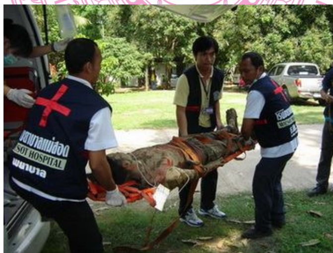
ภาพ อุบัติเหตุทางรถยนต์ที่เกิดจากการเมาแล้วขับ ซึ่งทำให้เกิดอุบัติเหตุ ที่รุนแรงบนท้องถนนได้