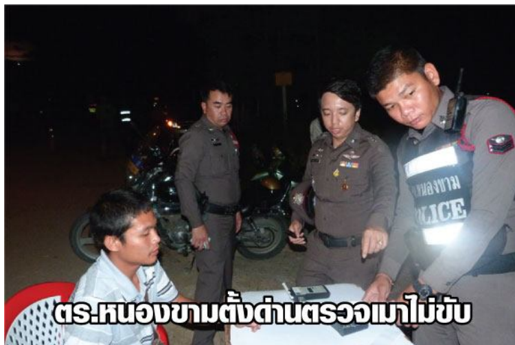
ภาพ การจับคนขับที่มีอาการมึนเมาในขณะที่ขับรถ ซึ่งมีให้เห็นในข่าว อยู่บ่อยครั้ง ซึ่งเป็นพฤติกรรมที่ไม่ควรเอาเยี่ยงอย่าง