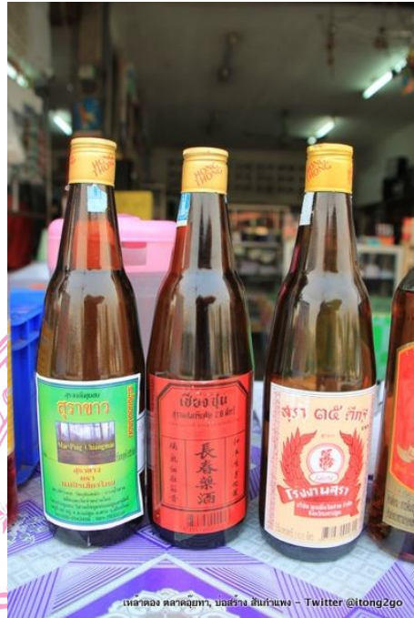
ภาพ สุราที่มีหลากหลายดีกรี เป็นสุราที่เป็นที่นิยมของคน ผู้มีรายได้น้อย